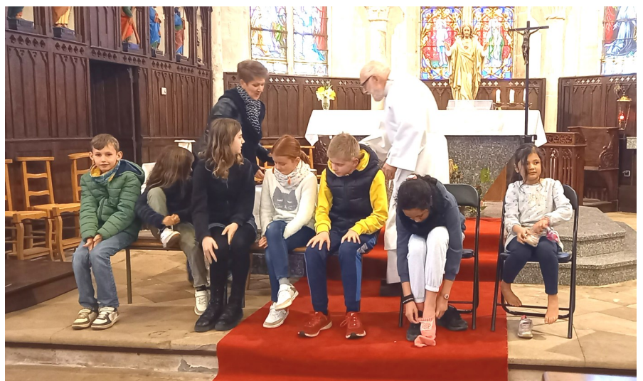
Les enfants du KT pendant le lavement des pieds

«Regardez l'humilité de Dieu.... et faites lui l'hommage de vos cœurs.»