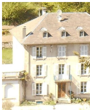
Maison de Charles Laggabe à Plombières – 2 rue de Remiremont

Semez de l'amour, vous récolterez de l'amour » a dit Saint Jean de la Croix. Cette bonté, c'est envers tous qu'il faut l'avoir : tous sont des fils du Père céleste, tous sont images de Dieu et membres de Jésus.